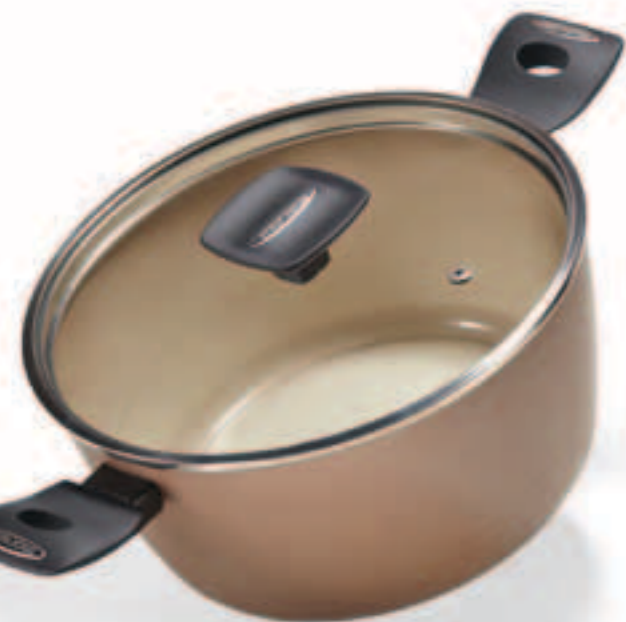
TEGAME 2 MANIGLIE CON COPERCHIO IN VETRO 2 HANDLE SKILLET WHIT GLASS LID