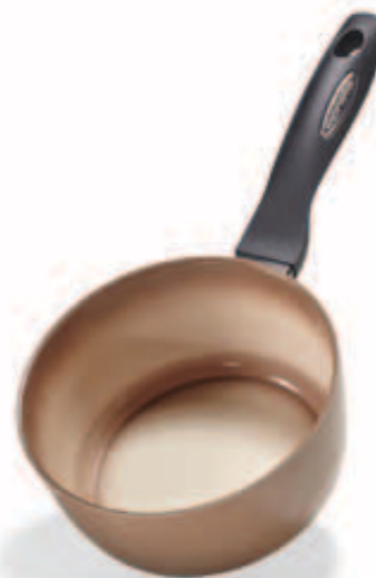
WOK 1 MANICO / WOK (1 handle)