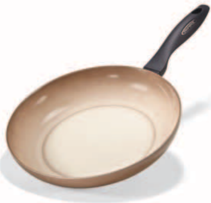
PADELLA / FRYPAN

The MONGRES Range features elegant shapes and earthy tone-shades that evoke the color of terracotta..